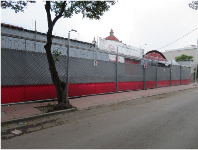
Fachada de las instalaciones