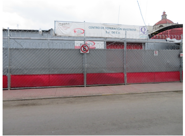
Fachada de las instalaciones