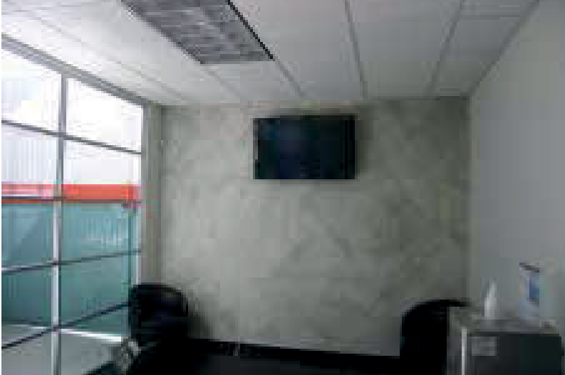
Sala de espera