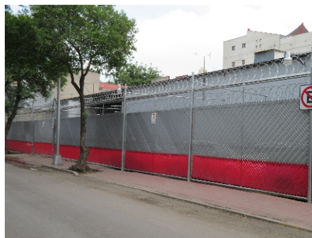
Recepción propio impulso