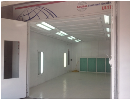
Cabina de pintura Global F. S. Ut (Área de pintura)