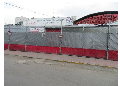
Recepción en grúa Callejón de San Antonio Abad No. 35